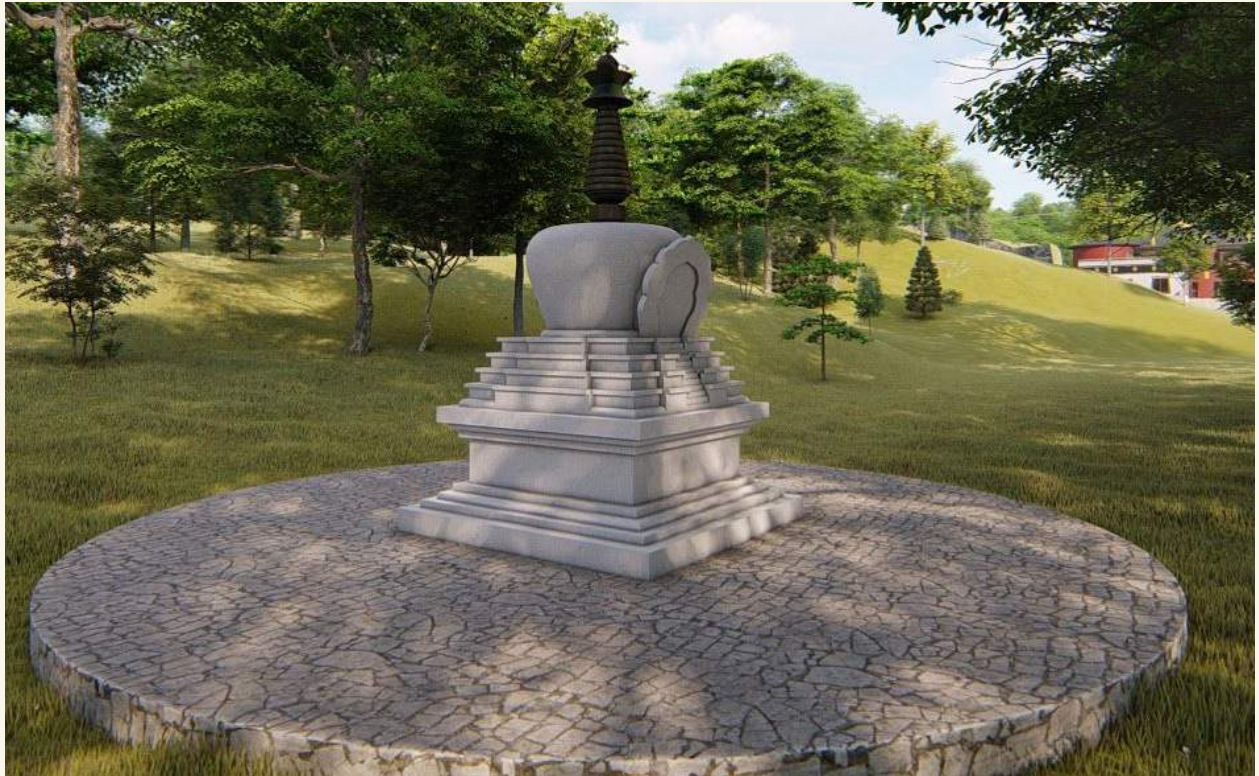
3D rendering of the project