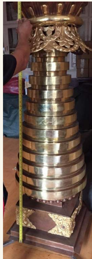
ཆོས་ཀྱི་འཁོར་ལོ་ ༡༣ cho khor 13 - “13 Dharma Chakras” (the top ornament of the stupa)

For the permits to bring Rinpoche's holy body to Albagnano, we have started the bureaucratic process involving four different levels of government. Most probably, the permission should be granted by mid-November.