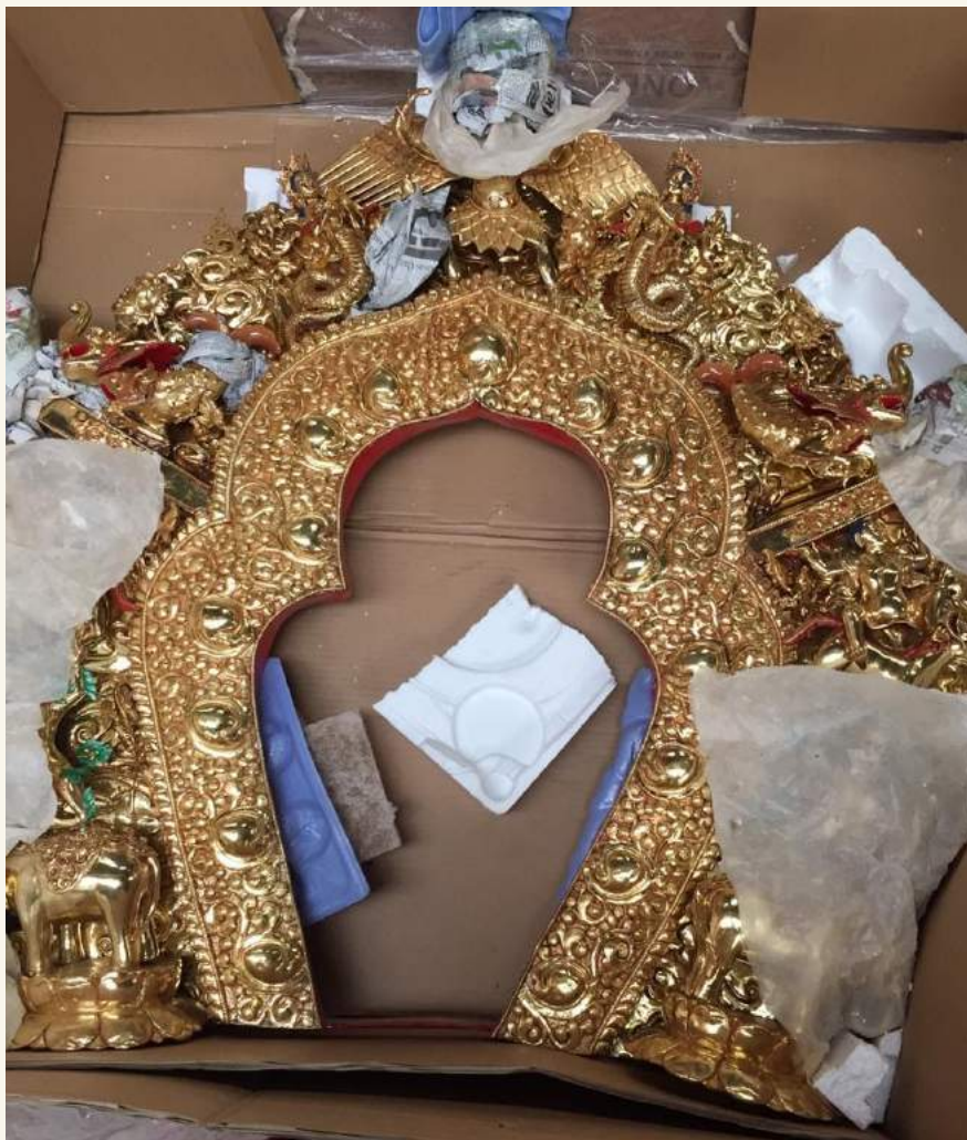
སྒོ་མཁོ་ལྷ་མོ། go khyim “front door” of the stupa made in Nepal