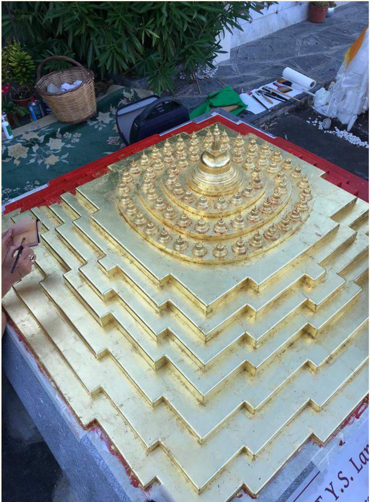
Borobudur Stupa Mandala monument at the cemetery of Biganzolo