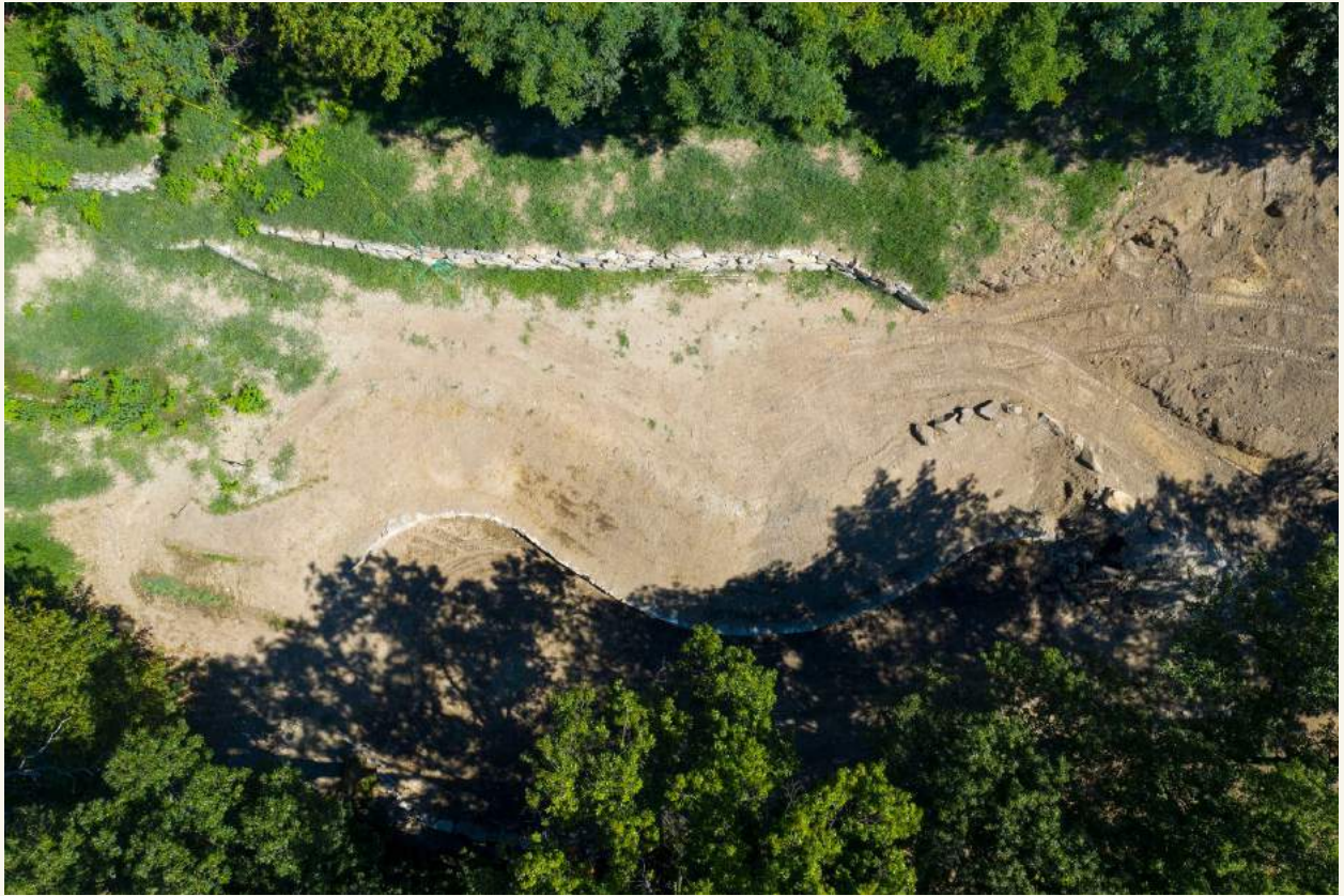
The location of the stupa as seen from above