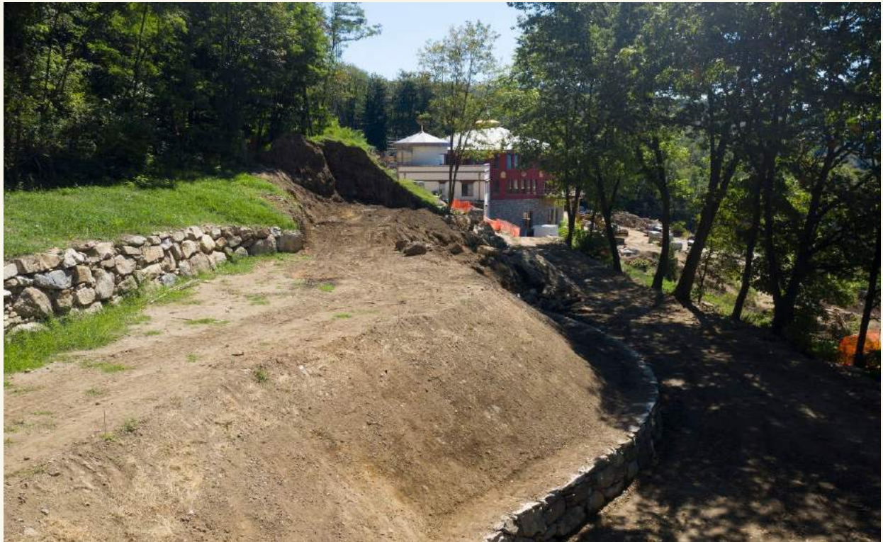
The position of the stupa