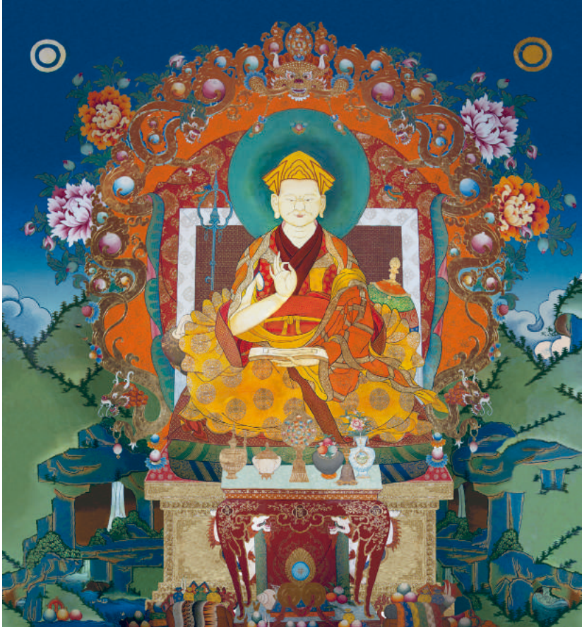
ལཱ་ཚེན་ལྷོ་བཟང་ཚོས་ཀྱི་རྒྱལ་མཚན།