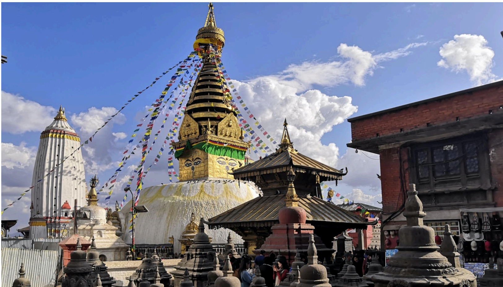
Stupa di Swayambunath, Kathmandu