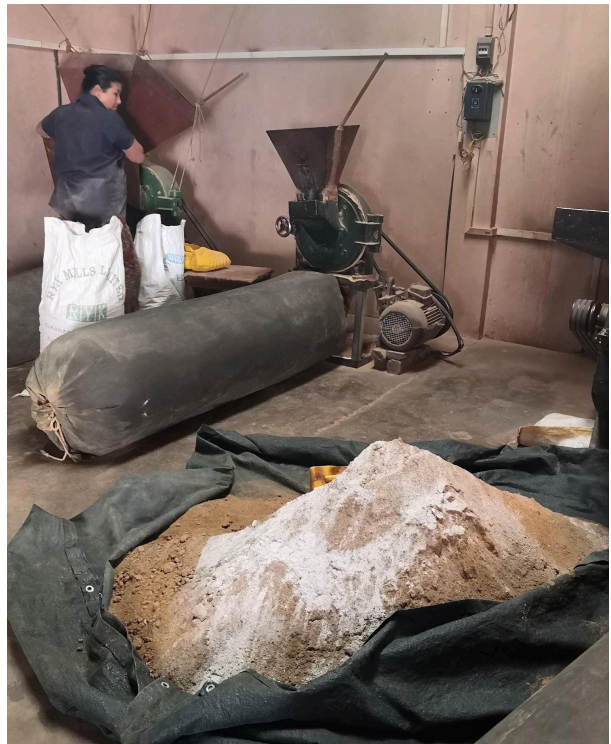
Artigiani al lavoro, Drubkhang Gangchen Labrang, Kathmandu