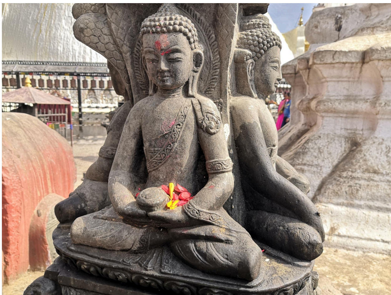
Particolare di piccola stupa a Swayambunath, Kathmandu

Per confermare l'iscrizione chiediamo di versare un acconto di 50 euro entro il 30 settembre 2025 tramite PayPal o in contanti. La quota rimanente potrà essere saldata successivamente prima della partenza.